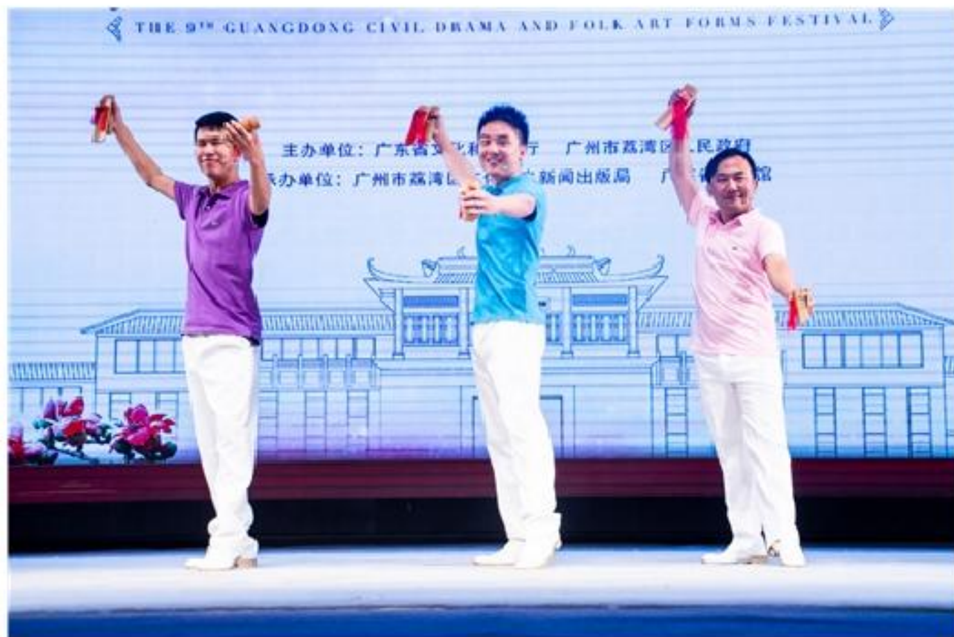
【快板书作品《告状》获省级奖】

11月11日，在广州市荔湾区粤剧博物馆举办了广州市粤剧博物馆广东省第九届群众戏剧曲艺花会，本次活动演出共吸引了近300名观众前来观看，来自广东省各市的原创曲艺类节目参加此次比赛，节目水平相对较高，现场观众秩序良好，观众对活动的评价很高。我中心作品《告状》获铜奖。